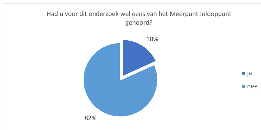
Grafiek 1. Aantal en percentage respondenten dat voor het onderzoek wel eens van het Meerpunt Inlooppunt had gehoord (n=1476)

Van de respondenten met thuiswonende kinderen (n=474) had gemiddeld 24% voorafgaand aan het onderzoek van het Meerpunt Inlooppunt gehoord. Van alleenstaande respondenten en respondenten zonder thuiswonende (933 respondenten) is dat gemiddeld 14%. Het Meerpunt Inlooppunt was het meest bekend bij eenoudergezinnen; 32% gaf aan er wel eens van gehoord te hebben.