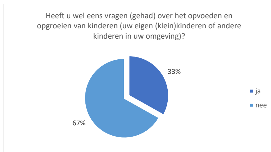
Grafiek 3. Aantal en percentage respondent(en) dat wel eens vragen heeft of had over het opvoeden en opgroeien van kinderen (eigen (klein)kinderen of andere kinderen in omgeving) (n=1461)

Gemiddeld hadden respondent(en) met thuiswonende kinderen, meer dan respondent(en) zonder thuiswonende kinderen, vragen over het opvoeden en opgroeien. Van de respondent(en) met thuiswonende kinderen is dat gemiddeld 53% en van de respondent(en) zonder thuiswonende kinderen is dat gemiddeld 21%.